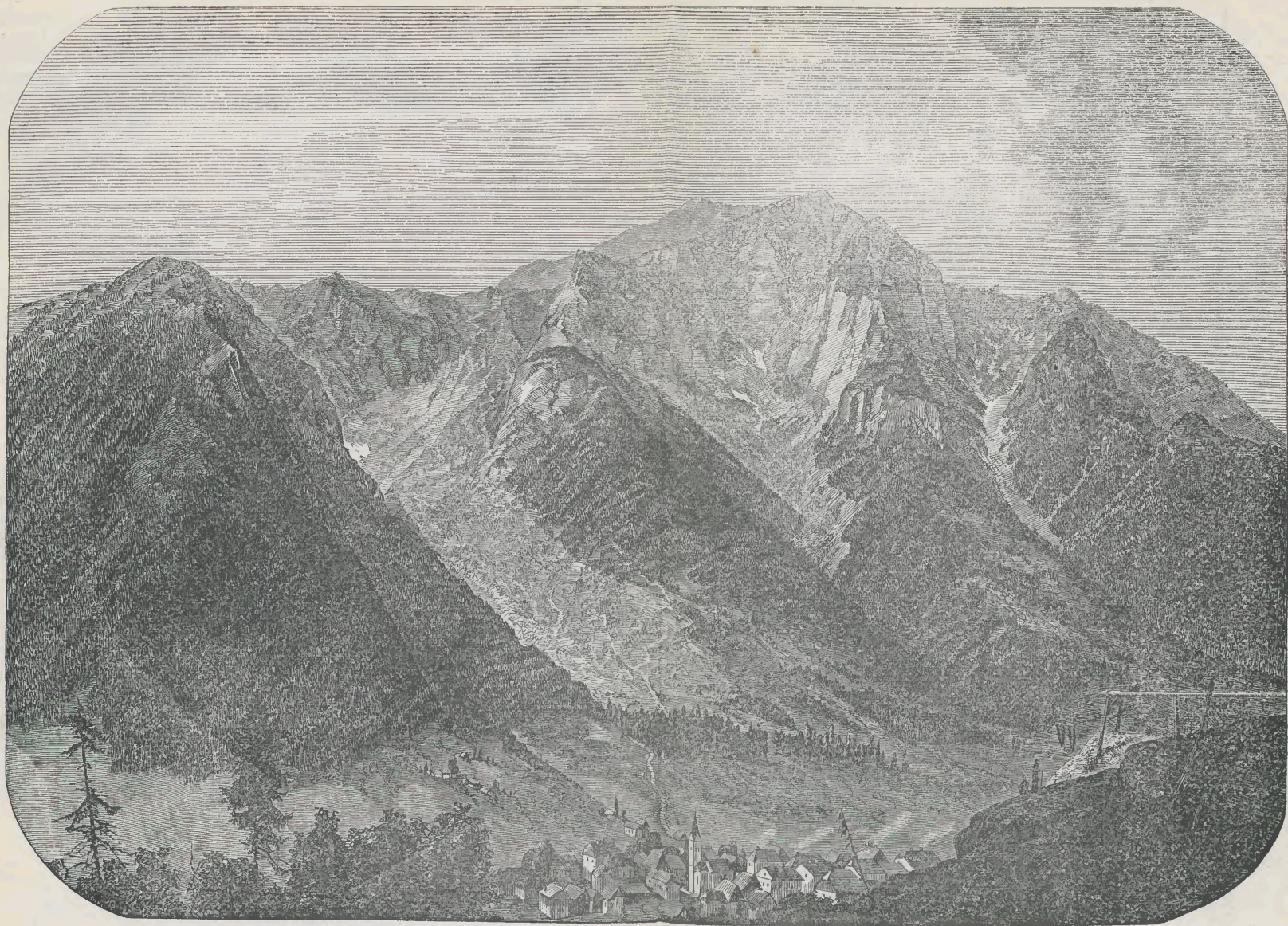
Bleiberg mit der Villacher Alpe, 6814 Fuss.